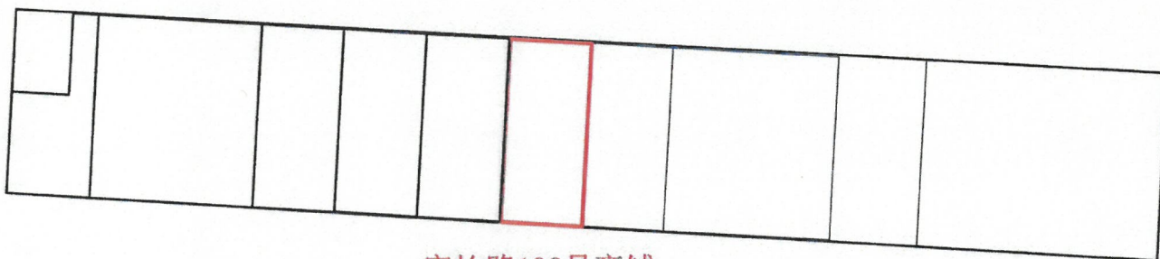
富怡路192号商铺 S建筑面积=45平方米